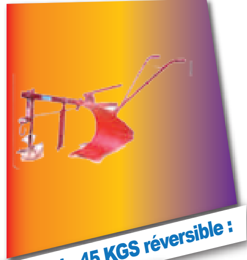
CHARRUE modèle 45 KGS réversible :

Dispositif de réglage continu vertical. Réglage latéral. Soc et versoir réversible. Largeur de travail : 0,22 m. Profondeur : 18 à 20 cm.