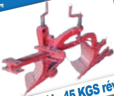
CHARRUE modèle 45 KGS réversible :

Dispositif de réglage continu vertical. Réglage latéral. Soc et versoir réversible. Largeur de travail : 0,22 m. Profondeur : 18 à 20 cm.