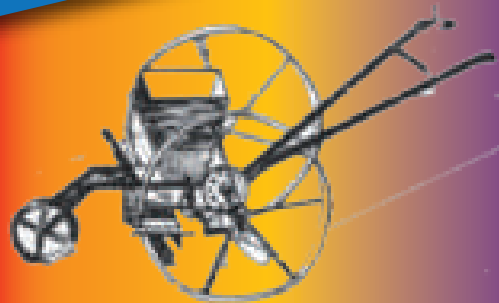
SEMOIR POLYVALENT MONORANG :

Attelage de Traction standard pour mini acteur avec trousse de réglage. Deux Poignées à vis : réglage profondeur. Double Soc droit avec carrelet réglable et versoir. Largeur de travail : 2*0,22 m. Profondeur : 18 à 20 cm.