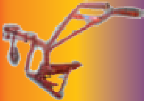
CHARRUE modèle 35 KGS :

Dispositif de réglage continu vertical. Réglage latéral. Soc et versoir réversible. Largeur de travail : 0,22 m. Profondeur : 18 à 20 cm.